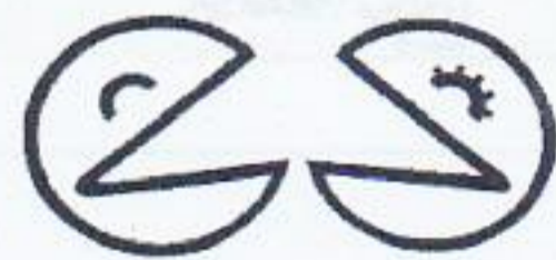
日本笑い学会のロゴ /